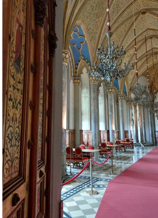
Blick in den Markgrafensaal